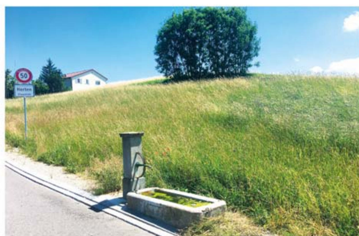
Der kleine, markante Brunnen beim Schulhaus Herten.