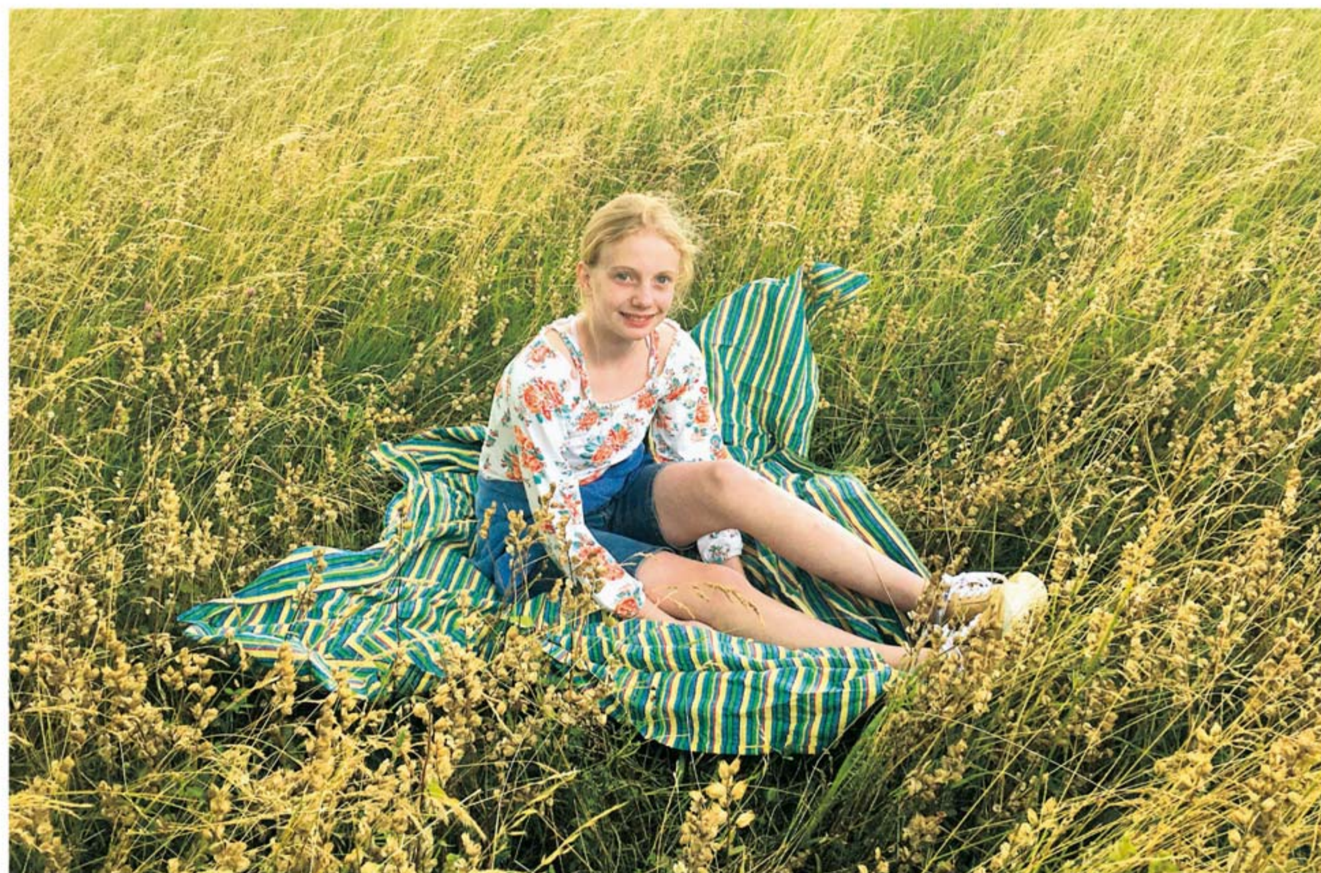
Das ist Lillys Lieblingsplatz.