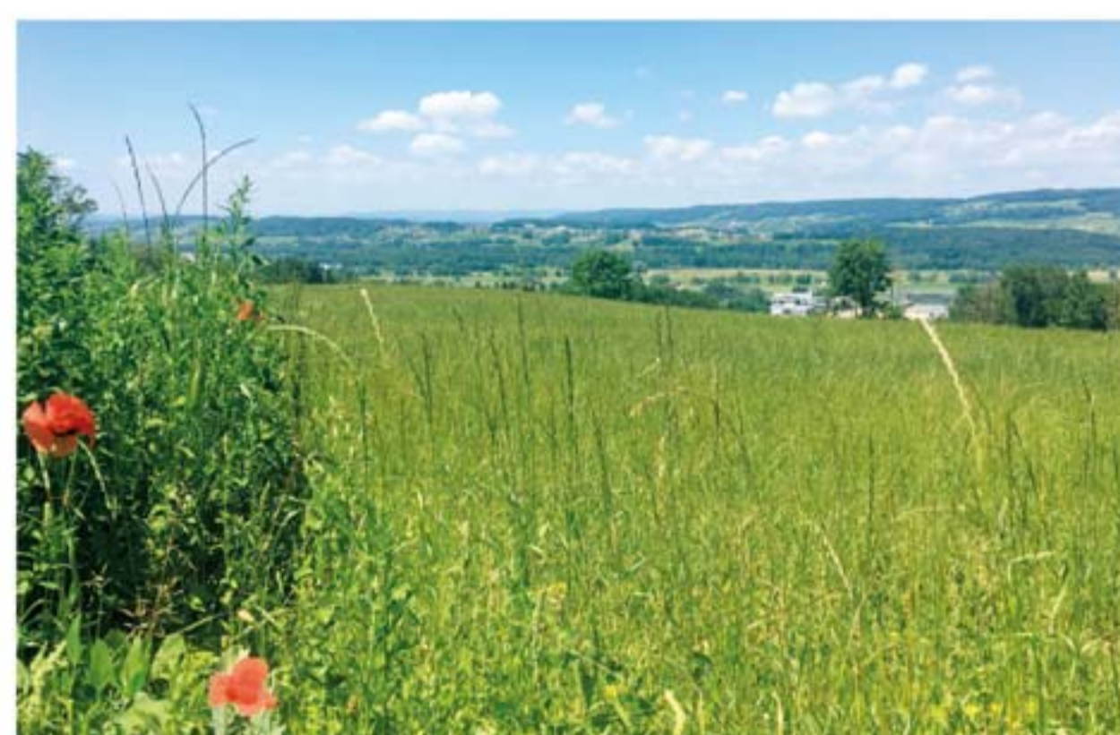
Der Blick über die Allmend bis zur Kartause Ittingen.